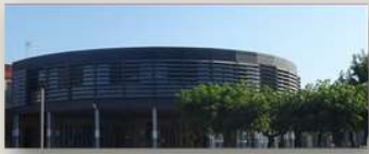
Collège Alfred Crouzet