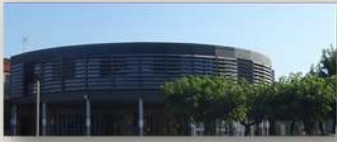
Collège Alfred Crouzet