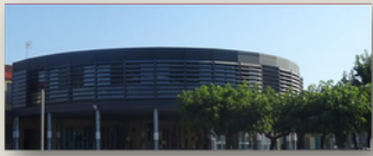
Collège Alfred Crouzet